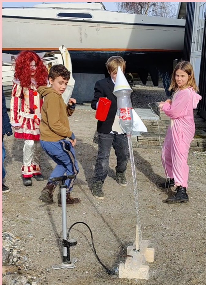
Forsinket nytårsraketaffyring. "Kabooms" til venstre og "Det kolde Gys" til højre.